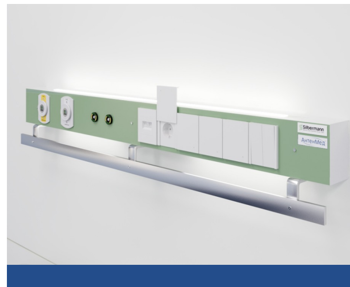
Крашеная передняя панель из анодированного алюминия по цвету из каталога RAL Classic.