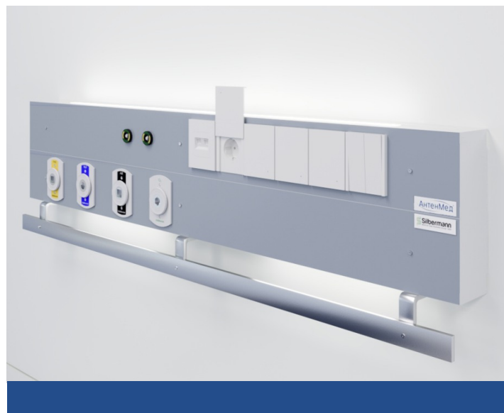
Двух - и более рядное исполнение с передней панелью из крашеного анодированного алюминия или стекла.