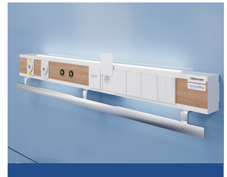
Печать любых изображений на передней панели из каленного стекла.