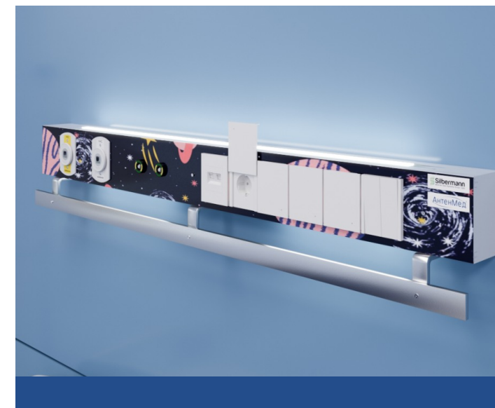
Панель из закалённого стекла с изображением детских иллюстраций.